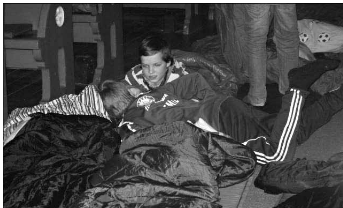
Ikke helt lys våken på Lys Våken i Alvdal kirke 2011.