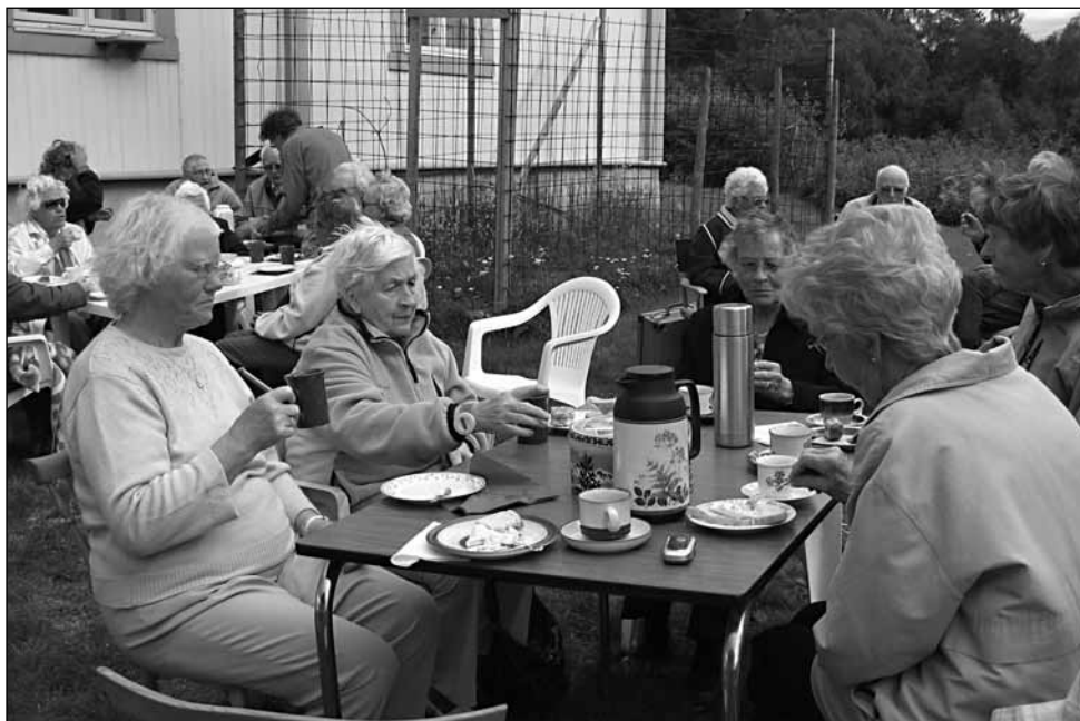
Besøktjenesten arrangerte hageselskap i prestegarden i 2008: været var ikke helt på vår side!