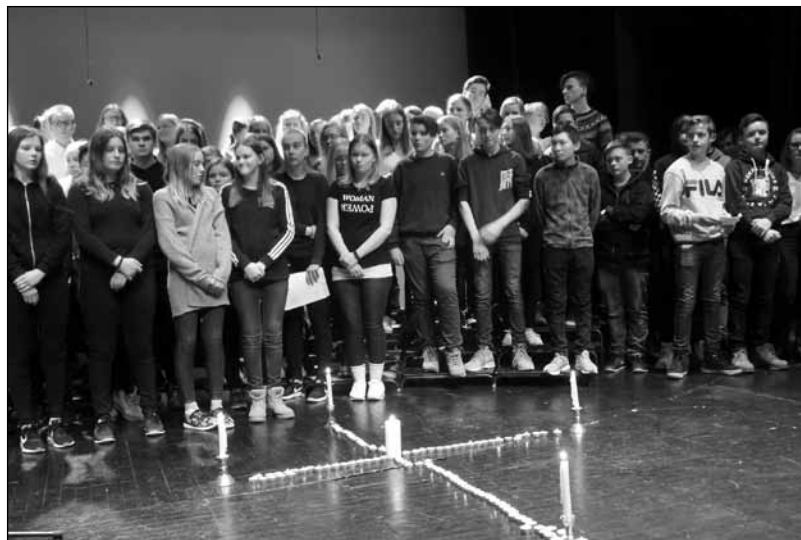
Konfirmantkor 2018 med konfirmanter fra omtrent hele Nord-Østerdal.