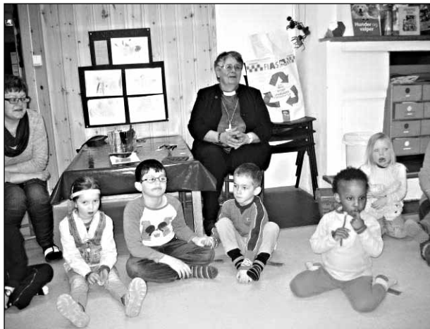
Biskop Solveig Fiske besøkte barnehagen ved visitasen i 2015